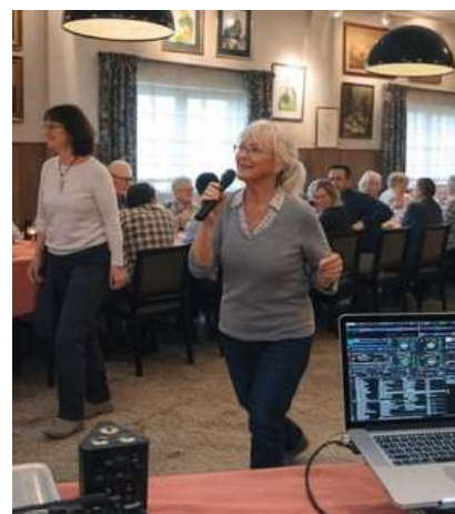
08/02/2026 - Restaurant Kohn Altwies